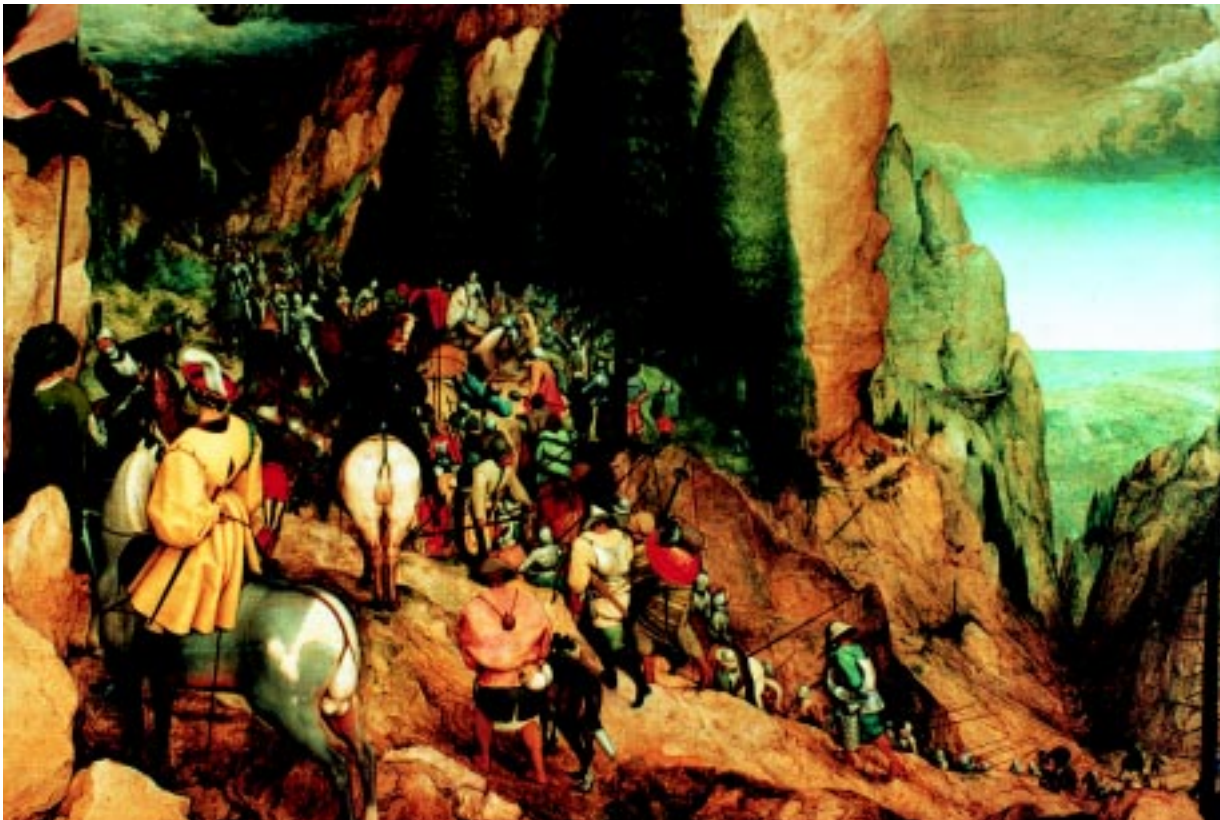
P. Brueghel: Conversion of Sct. Paul.