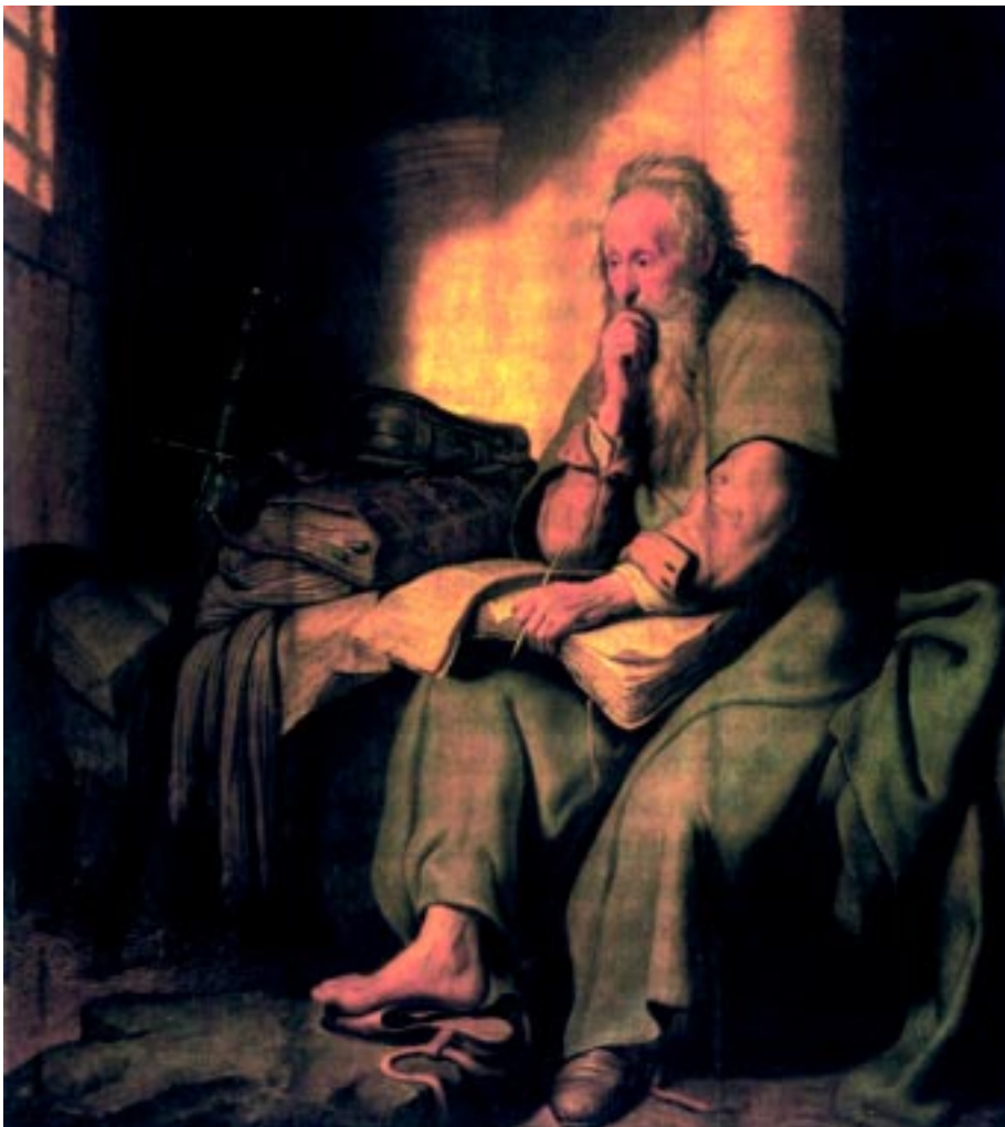
Rembrandt: Apostlen Paulus i fængsel

Igennem brevene og Apostlenes Gerninger får vi et indblik i det, der er hans ærinde, men også en skitse til hans biografi. Virksomhed og livsfortælling er hos Paulus vævet uadskilleligt sammen.