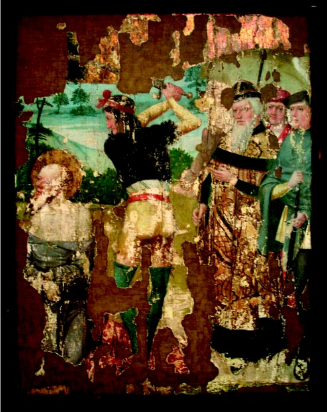
Paulus' henrettelse.