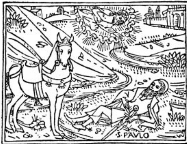
Træsnit fra Catalogus Sanctorum , Venezia 1506