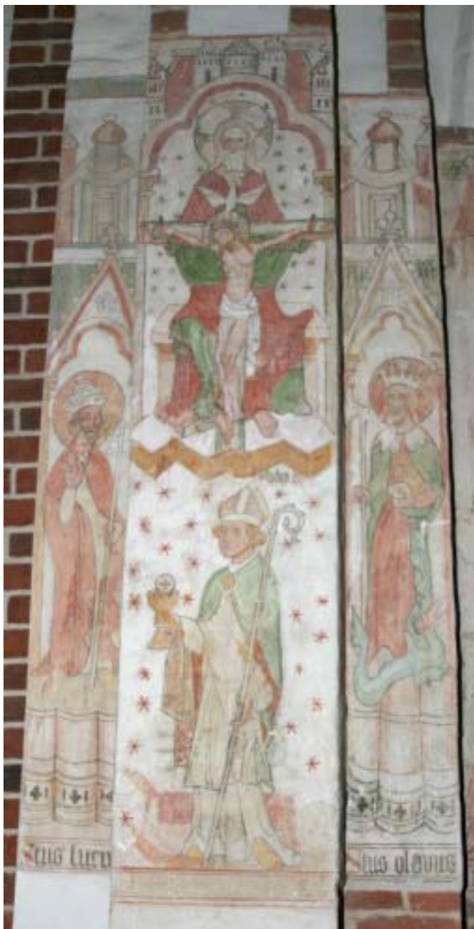
Nådestolen. Kalkmaleri Roskilde Domkirke