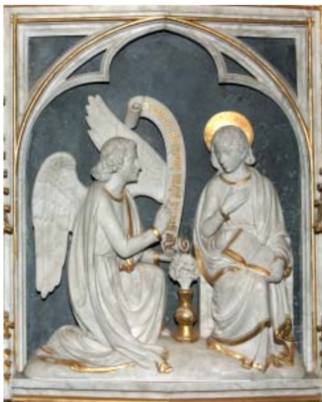
Marias bebudelse. Detalje, Margrethe I's sarkofag

De to stager og deres betydning: den gamle pagt, den nye pagt.