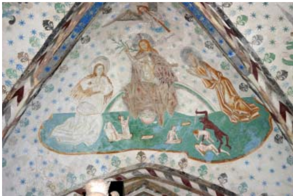
Roskilde Domkirke: Hellig tre kongers kapel. Kristus som pantokrator.

Marias/Vor Frues historiske popularitet afspejler sig på mange måder i dagligdagens udtryk og betegnelser: Indenfor floraens verden betegner Jomfru Marias sengehalm gul, velduftende snerre eller timian; Maria-klokker findes i blå og hvid variant; fra billedkunsten er især den hvide Madonna-lilje kendt; Jomfru Marias nøgleknippe er den hulkrave-