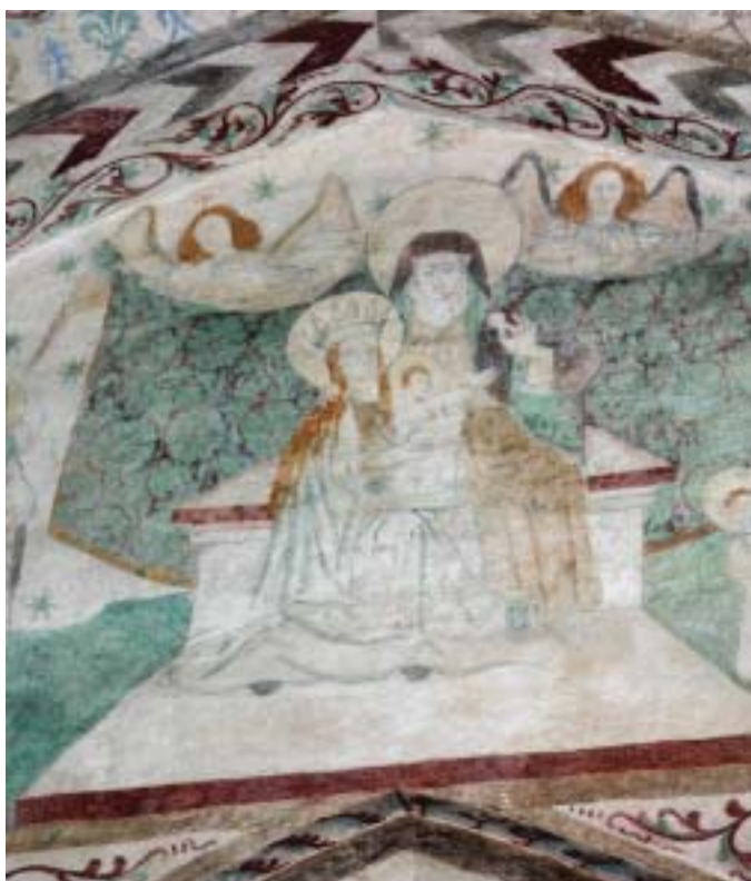
Anna Selvtredje. Hellig tre kongers kapel

Forklar supplerende betydningen af krukken med liljer. Hvorfor er den placeret i midten af billedet? (sml. at Maria undertiden omtales som et kar: 'vas'). Forklar også duen og alterbordet med de to stager i baggrunden af billedet. Nb!