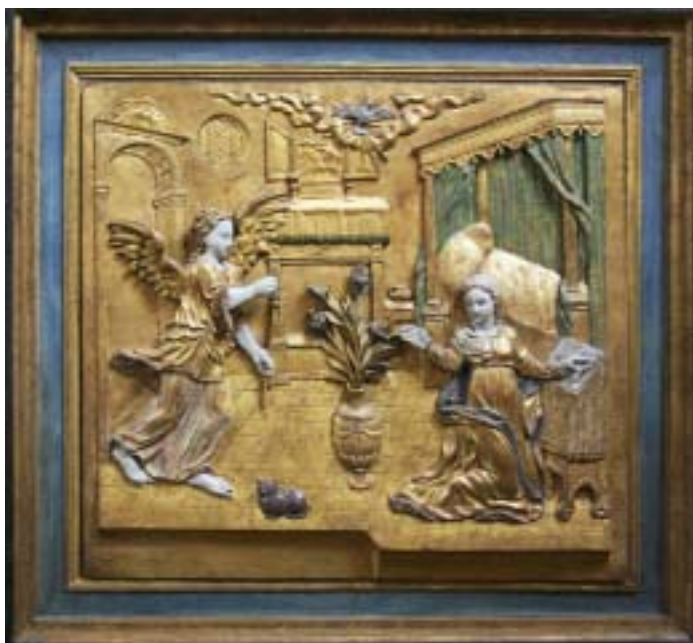
Marias bebudelse på altertavlens predella.