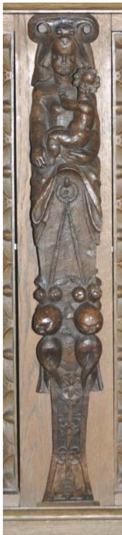
Madonna med barn. Detalje, Roskilde Domkirke.

Askepot- og klodshanshistorierne og utallige andre eventyr, frøkongen, prinsen og den fattige pige (eller korpigen i moderne tid) etc. er genigtninger af et centralt bibelsk motiv, nemlig at det næsten altid er klodshansskikkelsen, der vinder over dem, der er klogere og stærkere. Det er så meget mere tankevækkende som det i primitive samfund som dem, hvor Biblen og eventyrene er blevet til, altid er den ældste og førstefødte, som har krav på den fædrene arv. Men i en række afgø-