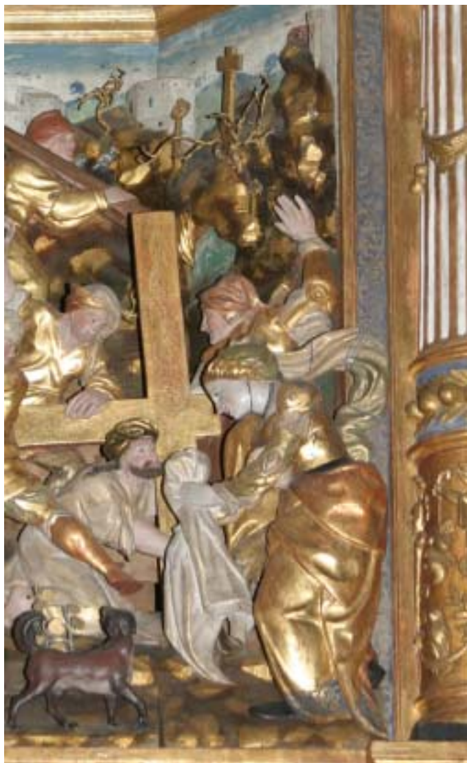
Kristus og Veronika med svededugen. Detalje, altertavle

Vis overhead med motivet fra alterpartiet i Roskilde. Kan konfirmanderne finde Veronica ? Perspektiverende og videreførende samtale: Ved man konkret noget om, hvordan Jesus egentlig har set ud?