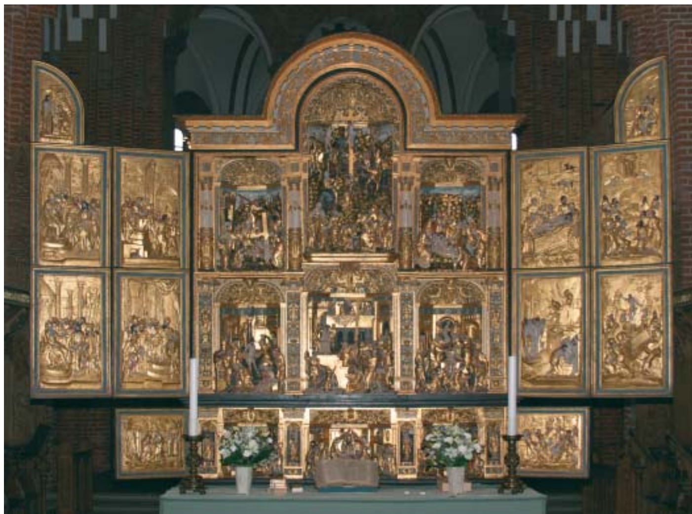
Altertavlen i Roskilde Domkirke

Altertavlen i Roskilde er fremstillet i omkring midten af 1500-tallet i Antwerpen.