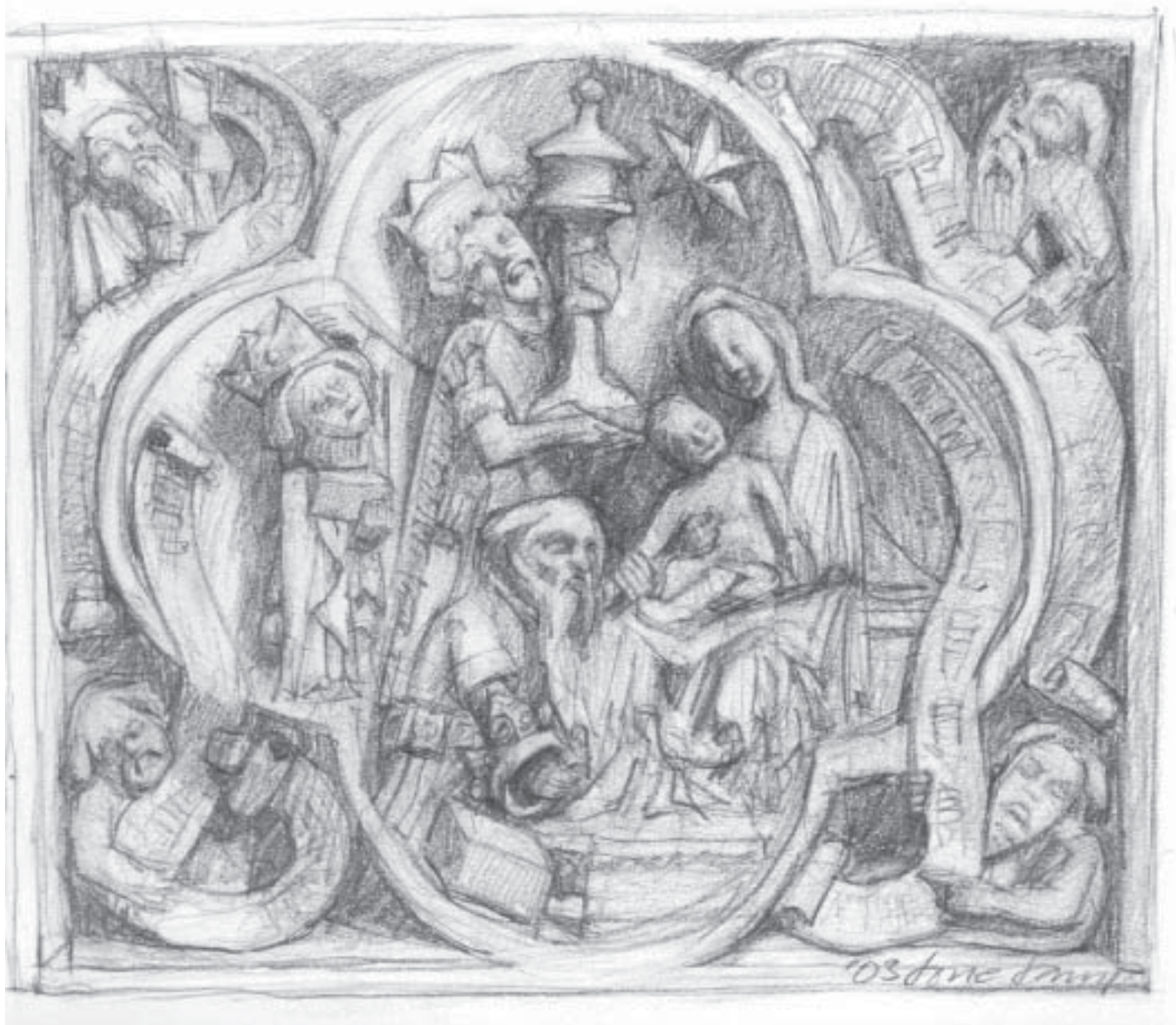
Vismændenes tilbedelse. Billedfelt ved Kannikestole, Roskilde Domkirke, tegnet af Lone Lamb

som inspiration til en gudstjeneste sammen med konfirmanderne og benyt lejligheden til at indøve eller vedligeholde kendskabet til de salmer, der skal synges ved gudstjenesten i Roskilde. Man kan naturligvis frit integrere og kombinere gudstjenesten med fx drama eller læseteater.